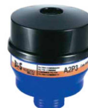
Cod. R334 (A2P3)