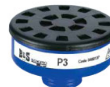
Cod. R333 (P3)