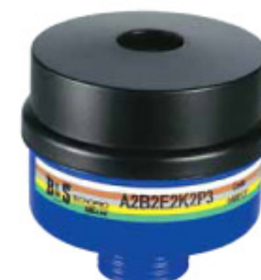
Cod. R338 (A2B2E2K2P3)