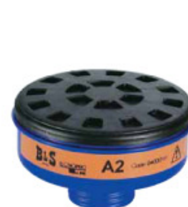
Cod. R332 (A2)